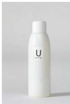
Ubeautyシリーズ VCローション ¥2,750(税込)